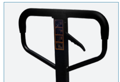
MANILLAR ERGONÓMICO DE FÁCIL MANEJO

Diseño y acabado de calidad para un manejo fácil. Pintura al polvo para máxima duración. Fácil funcionamiento con indicador multifunción y pantalla LCD.