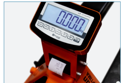
INDICADOR INTEGRADO CON PROTECCIÓN *Versión con impresora