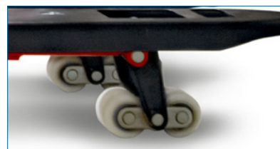
ALTURA MÁXIMA DE 205 mm