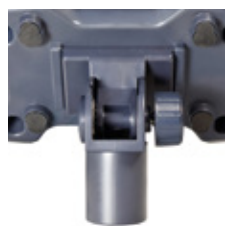
Codo adaptador para columna