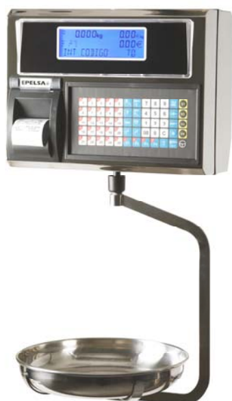
Urano 22 V4

Balanza colgante, 4 vendedores, con impresora