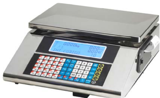
Urano 10 V4

La gama de balanzas Urano de GRUPO EPELSA está formada por una gran variedad de equipos que se muestran a continuación: