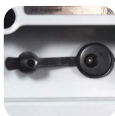
Protección en entrada de alimentación