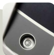
Nivel de burbuja