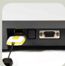
Salida RS232 y USB