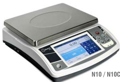
N10 / N10C