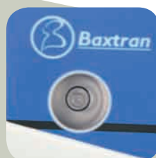
Nivel de burbuja