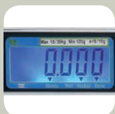
Pantalla trasera TW

En las capacidades de 15/30 kg ahora también pueden escoger los modelos con salida RS232 para la conexión a su terminal de punto de venta (TPV).