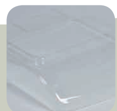
Blíster de protección