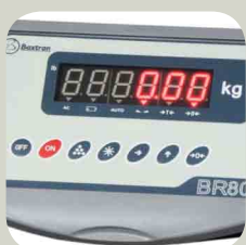
Display LED de 20 mm