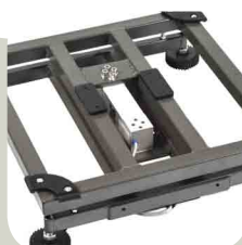
Estructura tubular en acero pintada