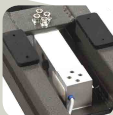
Célula de aluminio con protección IP65