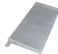
Rampa de acceso