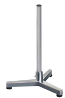
Columna en acero inoxidable