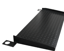
Rampa de acceso