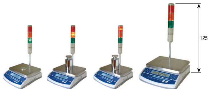
Verde < limit Ambar < limit Rojo < limit Semáforo con la función límites y señal acústica