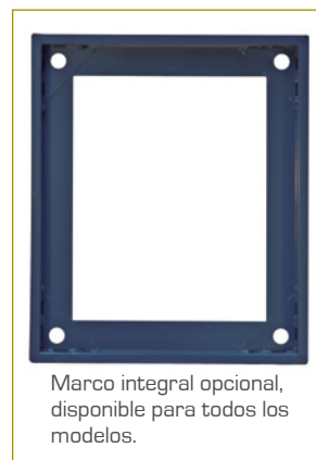
Marco integral opcional, disponible para todos los modelos.