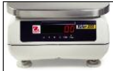
Valor 2000 con pantalla LED trasera